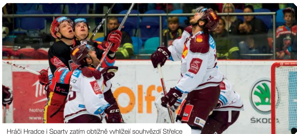
Hráči Hradce i Sparty zatím obtížně vyhlížejí souhvězdí Střelce