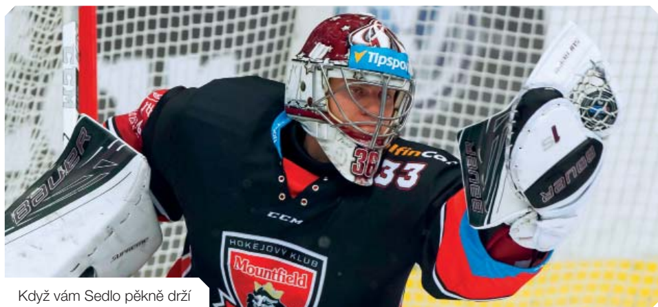
Když vám Sedlo pěkně drží