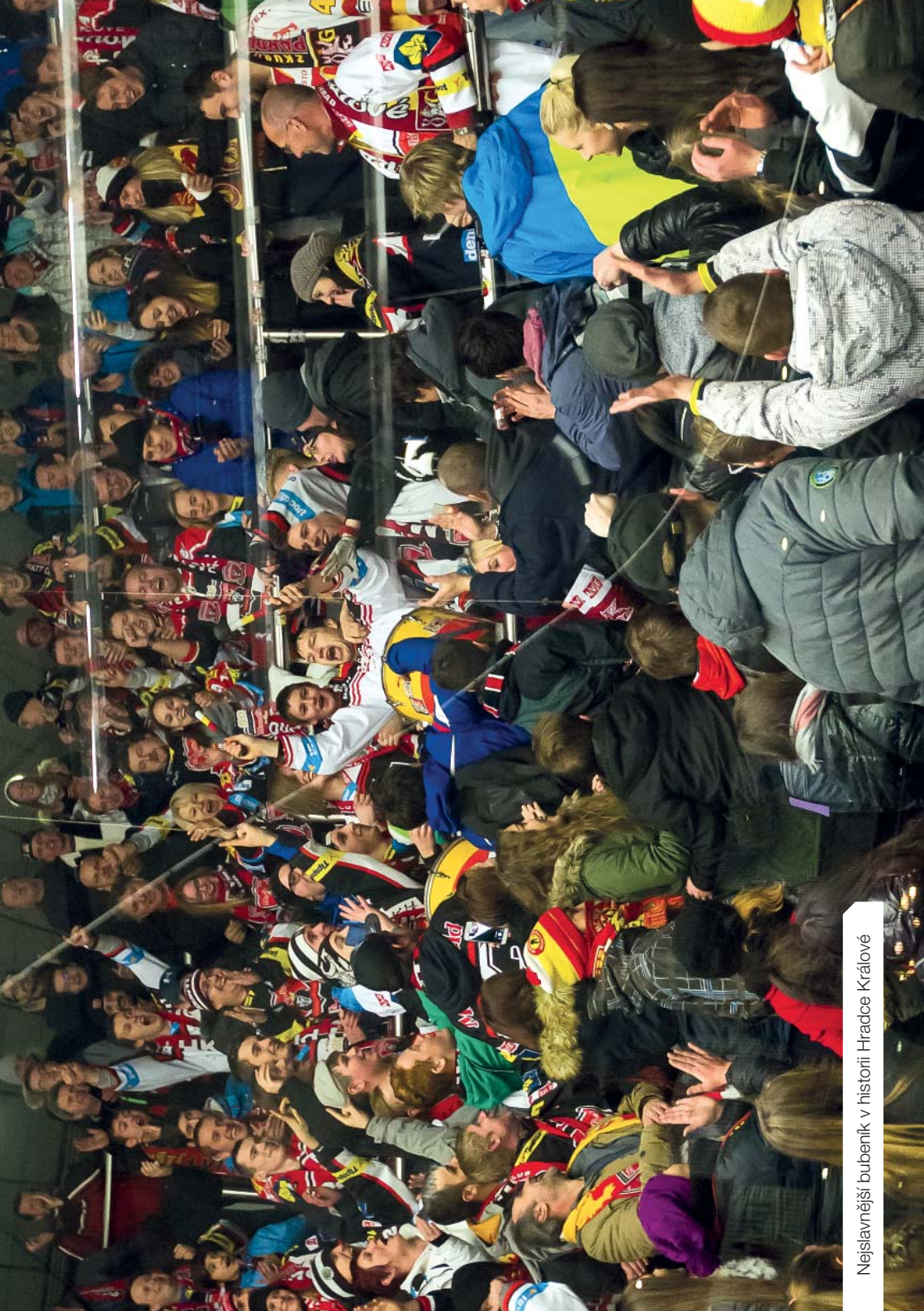
Nejslavnější bubnenk v historii Hradce Králové