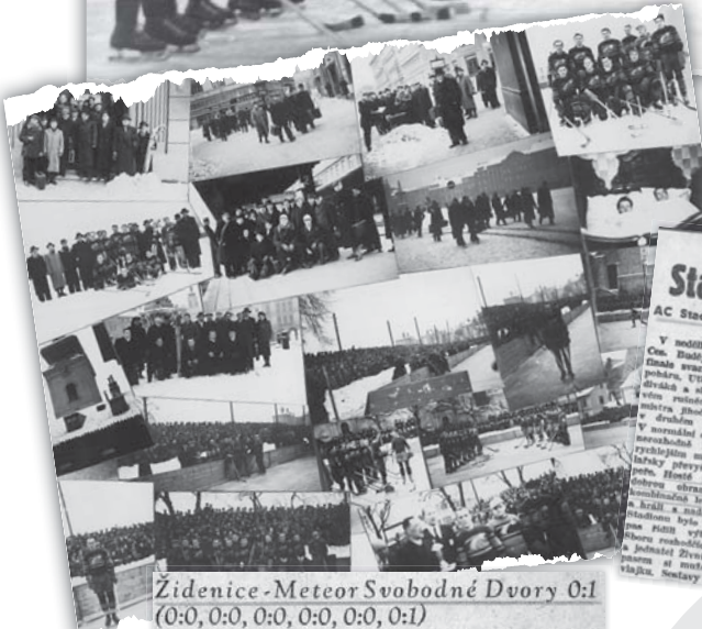
Fotografie a výstřižky mapujících úspěšnou zimu Meteoru.

Meteor Svobodné Dvory v důstojném soubojení. Stadion české Budějovice do ligy. AC Stadion Čes. Budějovice v. Meteor Svobod. Dvory 3:1 (0:0, 1:1, 0:0, 0:0, 2:0) v nastaveném čase. AC Stadion Čes. Budějovice V. Meteor Svobod. Dvory 3:1 (0:0, 1:1, 0:0, 0:0, 2:0) v nastaveném čase. AC Stadion Čes. Budějovice V. Meteor Svobod. Dvory 3:1 (0:0, 1:1, 0:0, 0:0, 2:0) v nastaveném čase. AC Stadion Čes. Budějovice V. Meteor Svobod. Dvory 3:1 (0:0, 1:1, 0:0, 0:0, 2:0) v nastaveném čase.