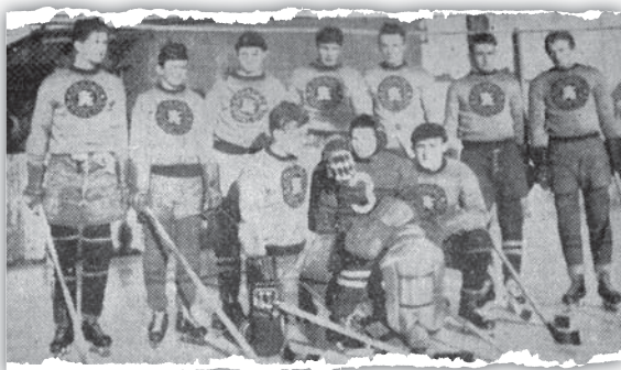
Mužstvo Slávie v úspěšné sezóně 1946-47. Vítězství v župním mistrovství znamenalo postup do divizní soutěže, tedy do druhé nejvyšší soutěže.

Minule jsme si ve čtvrtém díle vyprávění pověděli tom, jak v průběhu druhé světové války hrál Meteor Svobodné Dvory úspěšně ve Svazovém poháru a na počátku roku 1941 byl blízko postupu do nejvyšší soutěže. Válka rozhodně nebyla radostným obdobím, zájem lidí se mnohdy upnul i na sport. V Hradci Králové právě ve válečných letech, možná i díky úspěchům Meteoru, vznikala další družstva – Sparta Třebeš, SK Žižkov Kukleny, DTJ Plácky (později Polaban) či Slávie Hradec Králové. Vedle těchto mužstev se hrál hokej třeba na Pražském Předměstí či