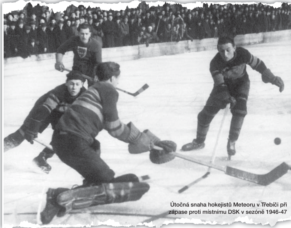
Útočná snaha hokejistů Meteoru v Třebíči při zápase proti místnímu DSK v sezóně 1946-47

Minule jsme si ve čtvrtém díle vyprávění pověděli tom, jak v průběhu druhé světové války hrál Meteor Svobodné Dvory úspěšně ve Svazovém poháru a na počátku roku 1941 byl blízko postupu do nejvyšší soutěže. Válka rozhodně nebyla radostným obdobím, zájem lidí se mnohdy upnul i na sport. V Hradci Králové právě ve válečných letech, možná i díky úspěchům Meteoru, vznikala další družstva – Sparta Třebeš, SK Žižkov Kukleny, DTJ Plácky (později Polaban) či Slávie Hradec Králové. Vedle těchto mužstev se hrál hokej třeba na Pražském Předměstí či