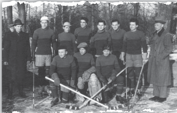
Fotografie Sparty Hradec Králové ze sezóny 1946-47, která byla pro mužstvo působící v Třebši nejúspěšnější v historii.