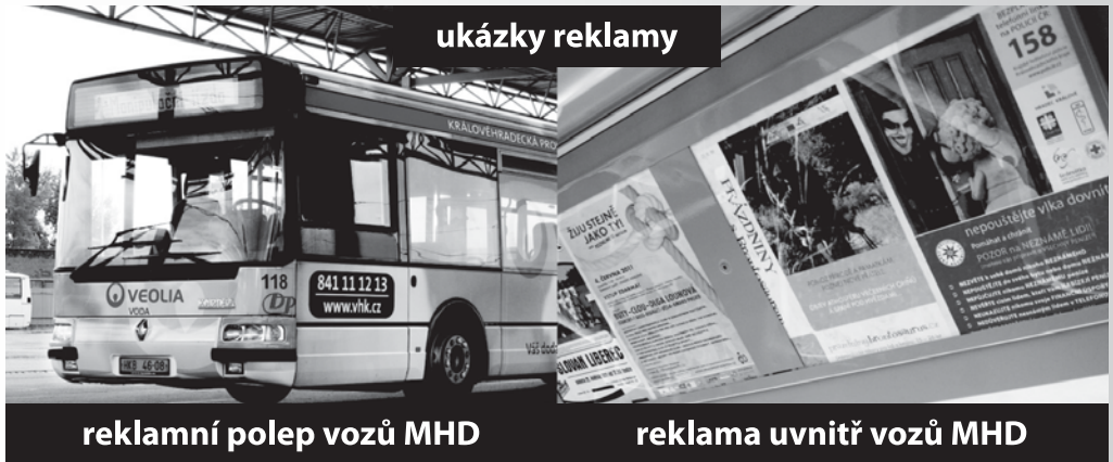
reklamní polep vozů MHD